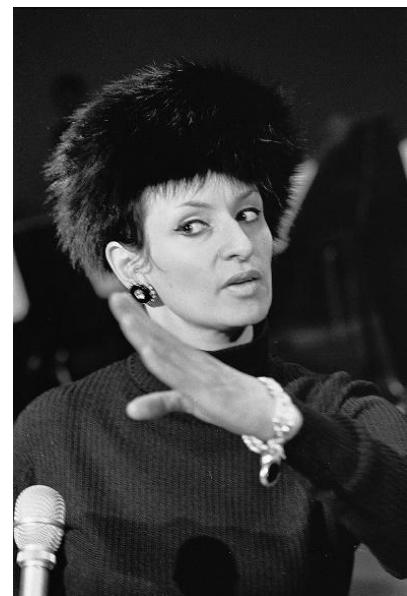
Barbara 1968

Juliette Gréco gilt als „Muse des Existenzialismus“ – Barbara hat mit „Göttingen“ die Hymne für die deutsch-französische Verständigung geschrieben und gesungen.