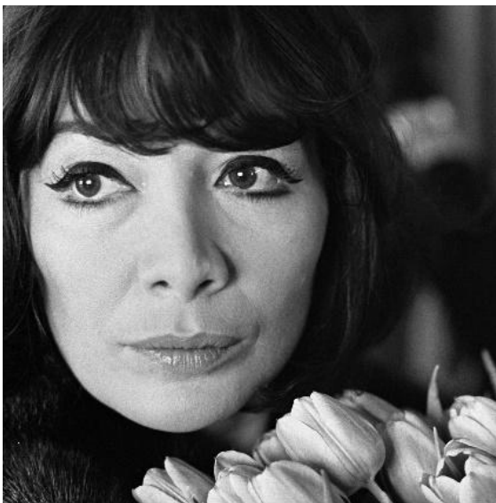
Juliette Gréco 1966