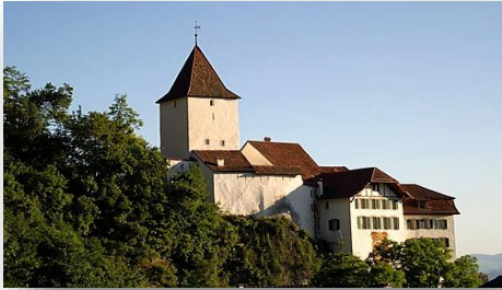
Schloss Wimmis