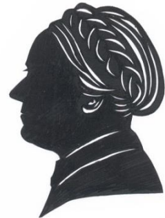
Luise Büchner-Gesellschaft e.V.